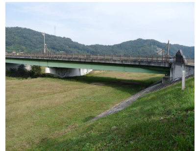
大渡橋の下あたりで、イベントを開催し ます。