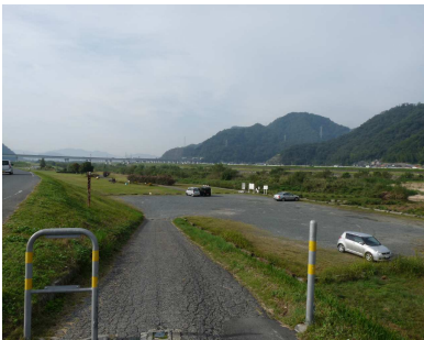
駐車場は大渡橋東詰の 土手を下りてすぐの場所です。